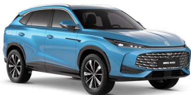
● MODRÁ ARCTIC ZÁKLADNÍ LAK