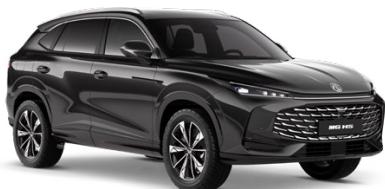
● ČERNÁ PEBBLE METALICKÝ LAK 18 500 Kč