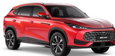
● ČERVENÁ DIAMOND METALICKÝ LAK 18 500 Kč