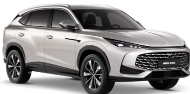
○ STŘÍBRNÁ STERLING METALICKÝ LAK 18 500 Kč