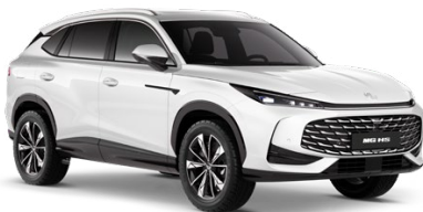
○ BÍLÁ PEARL METALICKÝ LAK 18 500 Kč