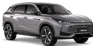
● ŠEDÁ HAMPSTEAD METALICKÝ LAK 18 500 Kč